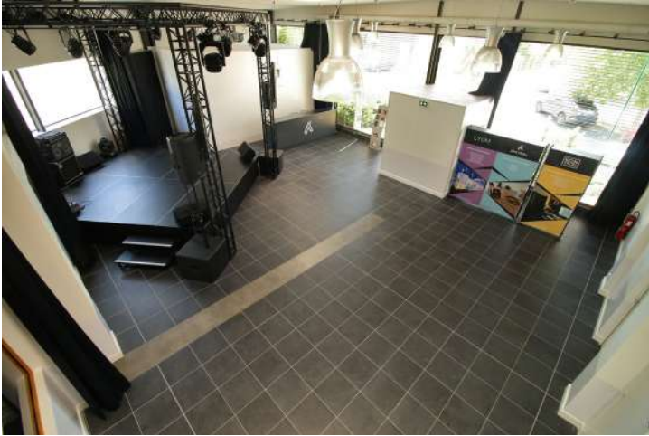
Grande salle - Vision de Jour