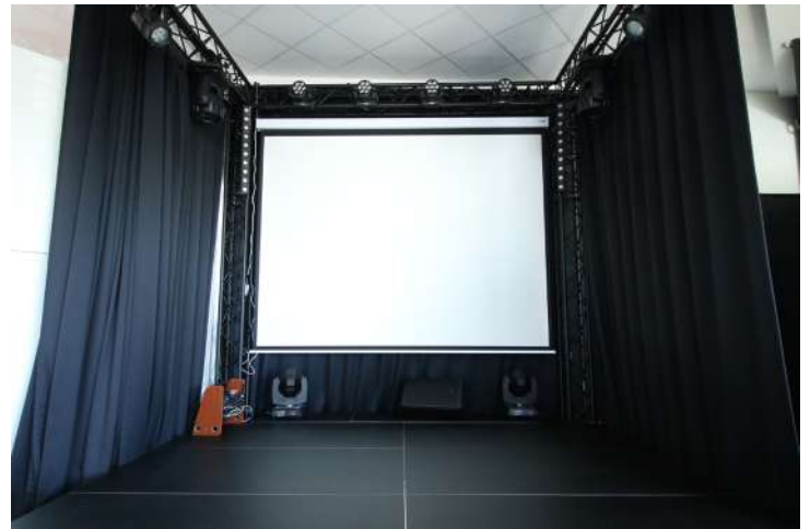
Espace Scénique - Ecran de projection