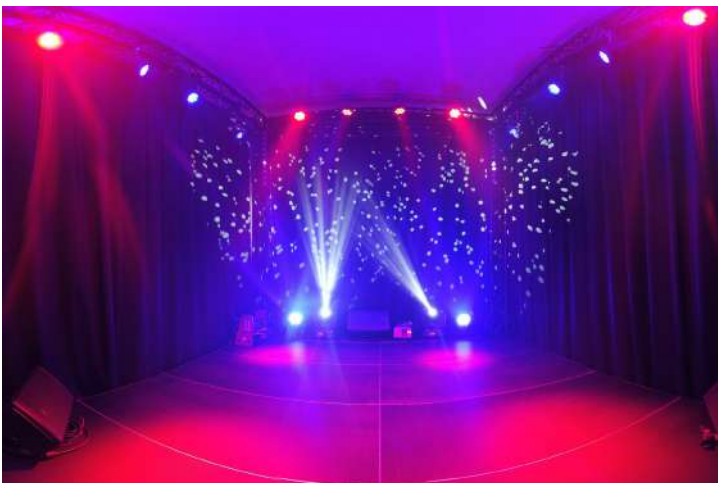
Espace Scénique - Concert