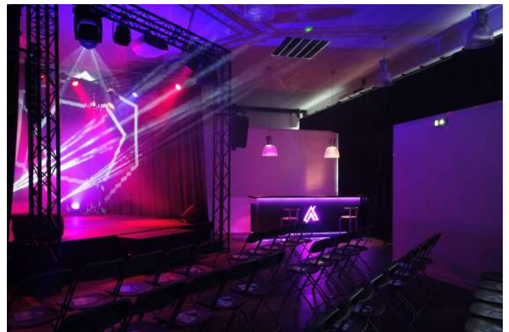
Espace Scénique - Concert