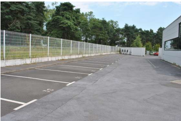
Parking - Vue 1