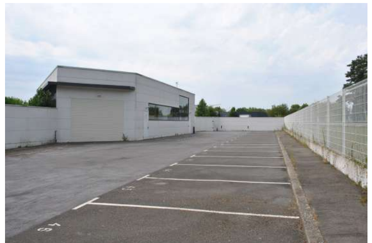
Parking -Vue 2