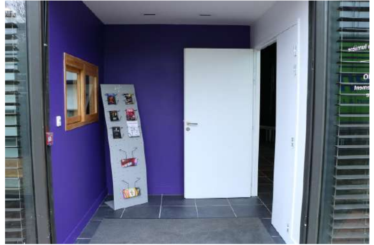
SAS et Billetterie