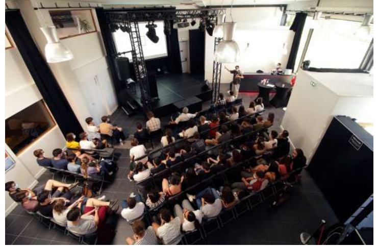
Grande salle - Conference