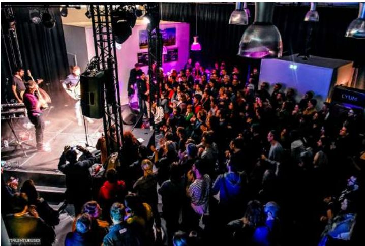
Grande salle - Concert